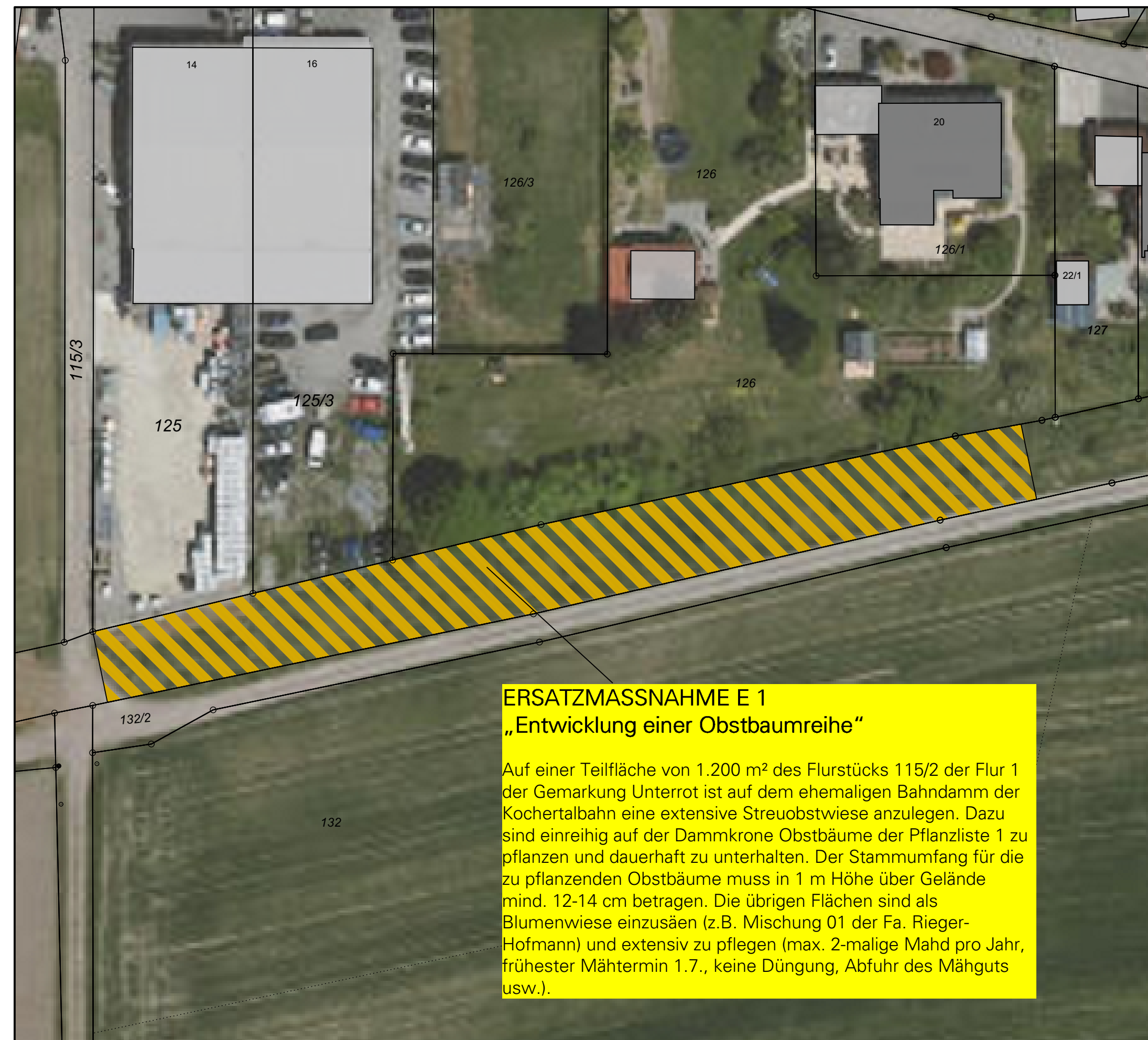
Ersatzfläche Bestand / Planung M 1:500

ERSATZMASSNAHME E 1 „Entwicklung einer Obstbaumreihe“ Auf einer Teilfläche von 1.200 m 2 des Flurstücks 115/2 der Flur 1 der Gemarkung Unterrot ist auf dem ehemaligen Bahndamm der Kochertalbahn eine extensive Streuobstwiese anzulegen. Dazu sind einreihig auf der Dammkrone Obstbäume der Pflanzliste 1 zu pflanzen und dauerhaft zu unterhalten. Der Stammumfang für die zu pflanzenden Obstbäume muss in 1 m Höhe über Gelände mind. 12-14 cm betragen. Die übrigen Flächen sind als Blumenwiese einzusäen (z.B. Mischung 01 der Fa. Rieger-Hofmann) und extensiv zu pflegen (max. 2-malige Mahd pro Jahr, frühester Mähtermin 1.7., keine Düngung, Abfuhr des Mähguts usw.).